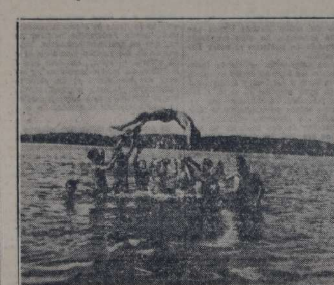
Jóvenes de la Unión Deportiva de Leipzig, que hacen ejercicios en el río Saale. La fotografía muestra uno de los tantos números del programa desarrollado en la excursión que realizó la Unión Deportiva, pasaje que durante la temporada de verano se efectúan todos los domingos y días festivos.

Adoptó resoluciones la C. D. del club Arg. de Bánfield